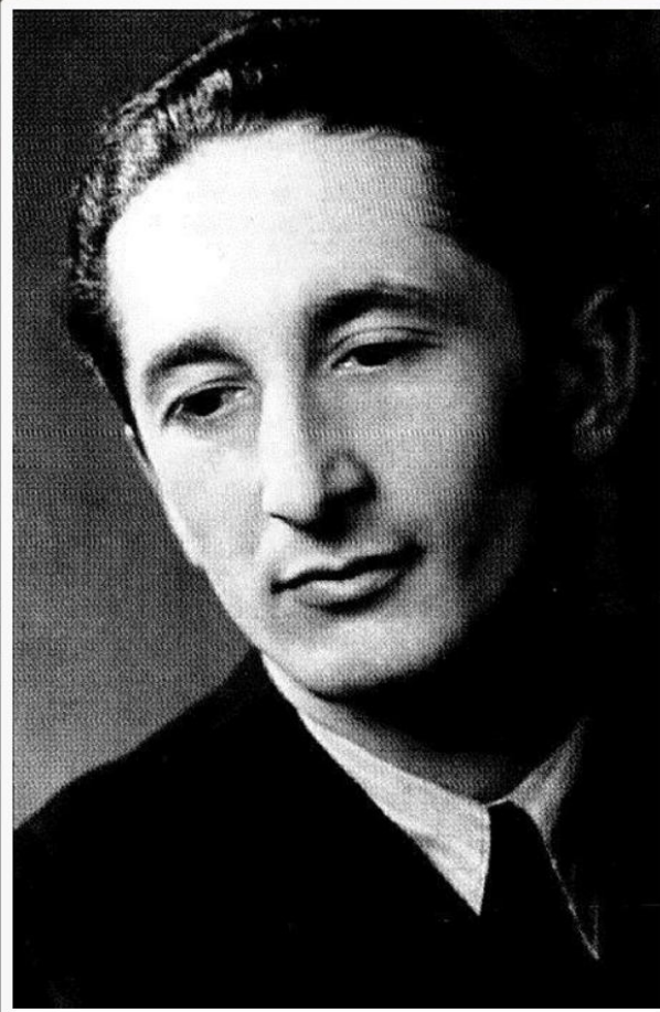
László Weiner Kompositör och dirigent.

Weiner var en ungersk tonsättare med judiskt påbrå och är en av dessa "vad kunde det ha blivit av honom?".